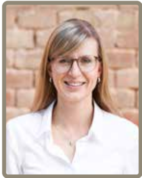
Katrin Albsteiger Oberbürgermeisterin der Stadt Neu-Ulm