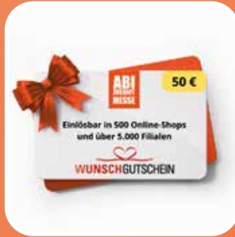
50 € Wunschgutschein