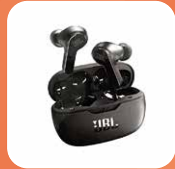
JBL Bluetooth Kopfhörer