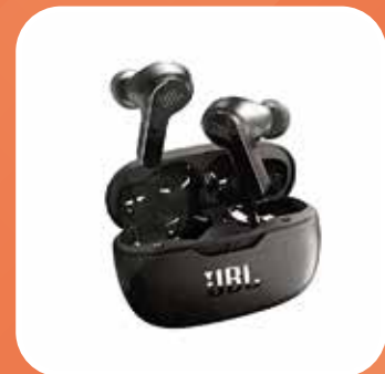
JBL Bluetooth Kopfhörer