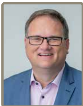
Björn Fecker Bürgermeister und Senator für Finanzen der Freien Hansestadt Bremen