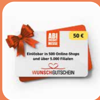
50 € Wunsch- gutschein