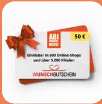
50 € Wunsch- gutschein