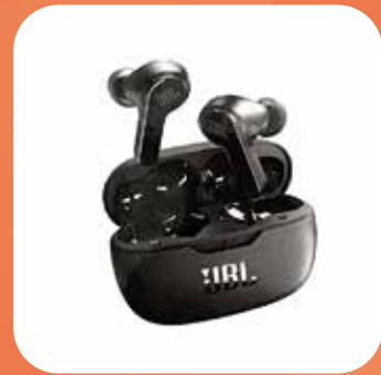
JBL Bluetooth Kopfhörer