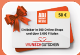
50 € Wunsch- gutschein