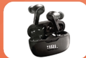
JBL Bluetooth Kopfhörer