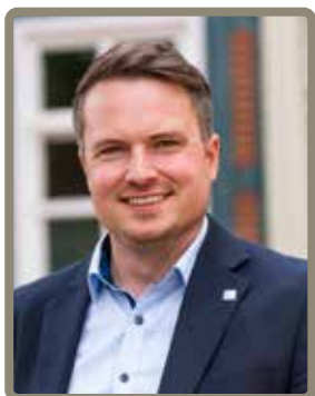
Dominic Herbst Bürgermeister der Stadt Neustadt am Rübenberge