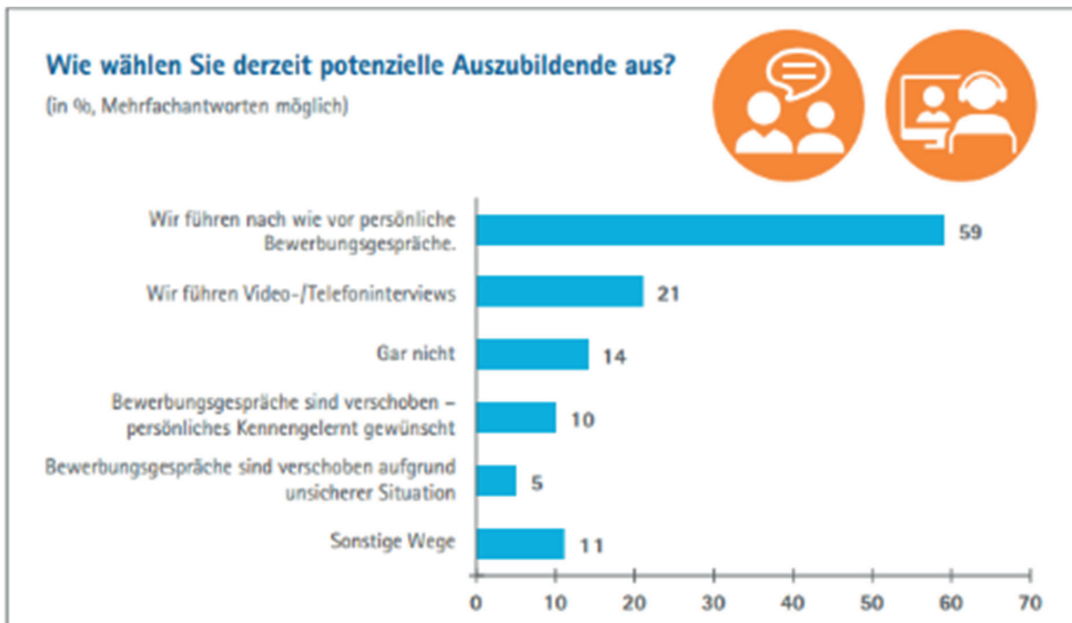
Abbildung 1: