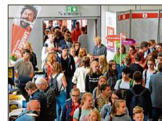
Viel Andrang: Abi Zukunft im Vorjahr.

Es wird erneut dazu eingeladen, dass Eltern und Kinder die Messe gemeinsam besuchen. Am 24. 8. (Sa, 11.55 Uhr) findet dazu wieder ein spezieller Eltern-Workshop mit dem Titel „Den passenden Berufsweg finden – Berufsorientierungstests im Check“ statt, in dem gezeigt wird, wie Eltern ihren Kinder im Prozess der Berufsentscheidung hel-