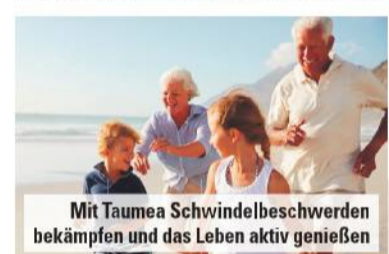
Mit Taumea Schwindelbeschwerden bekämpfen und das Leben aktiv genießen

Die Nerven senden ständig Gleichgewichtsinformationen an das Gehirn. Kommt es zu Störungen im Nervensystem, kann die Übertragung dieser Informationen behindert werden und Schwindelbeschwerden entstehen. Bereits unsere Vorfahren wussten, dass sie ihre Beschwerden mit natürlichen Wirkstoffen