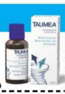
Abbildung Betroffenen nachempfunden TAUMEA, Wirkstoffe: Anamirta cocculus Dil. D4, Gelsemium sempervirens Dil. D5. TAUMEA wird angewendet entsprechend dem homöopathischen Arzneimittelbild. Dazu gehört: Besserung der Beschwerden bei Schwindel. www.taumea.de • Zu Risiken und Nebenwirkungen lesen Sie die Packungsbeilage und fragen Sie Ihren Arzt oder Apotheker. • PharmaSGF GmbH, 82166 Gräfelfing

Für Ihren Apotheker: Taumea (PZN 07241184)