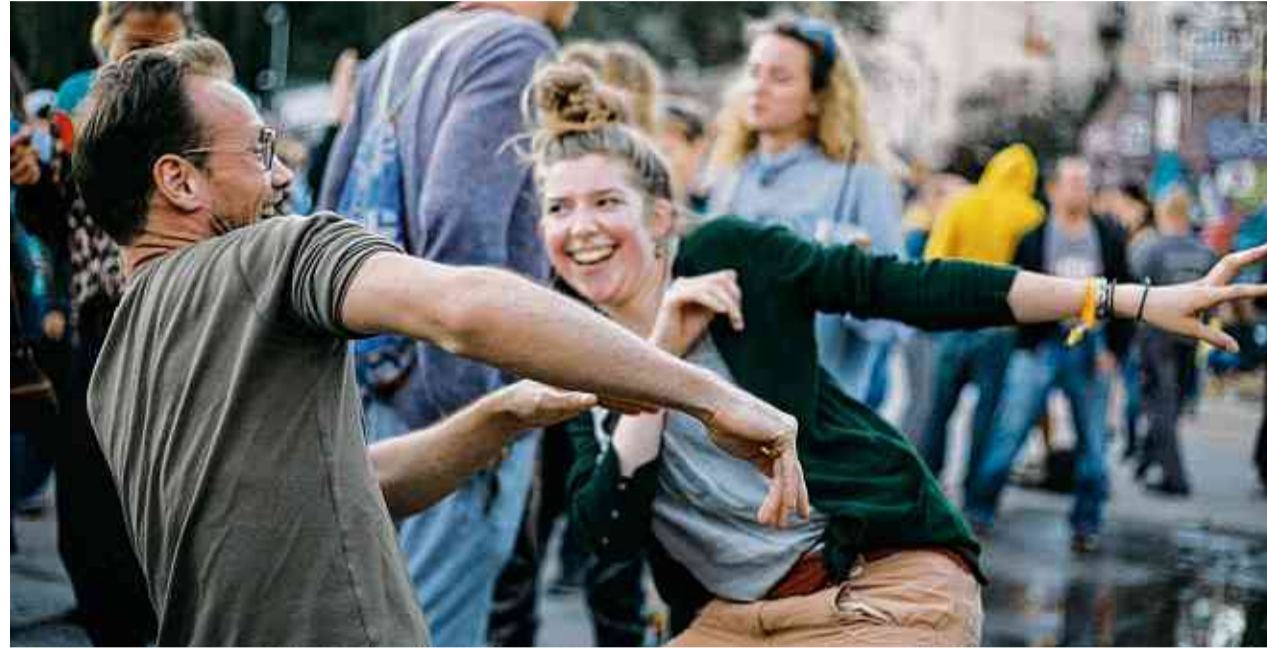
Spaß und Freude am Musiksommer.

Der Plan zur Musik. Die offiziellen Konzertorte finden sich auf der Seite der Fête im Internet. Von Klassik über Folk bis zu Pop und Jazz sind eigentlich alle denkbaren Musik-Genres an diesem Tag vertreten. In ganz Berlin haben sich dazu in allen zwölf Bezirken weit über 150 offizielle Veranstalter, Vereine, Initiativen, Schrebergärtner und Gewerbetreibende gemeldet, die einen Musikort organisieren und so dafür sorgen wollen, dass viele Zehntausende Musikfans bei freiem Eintritt Konzerte genießen können. 610 Veranstaltungen werden berlinweit stattfinden. Das Spektrum der