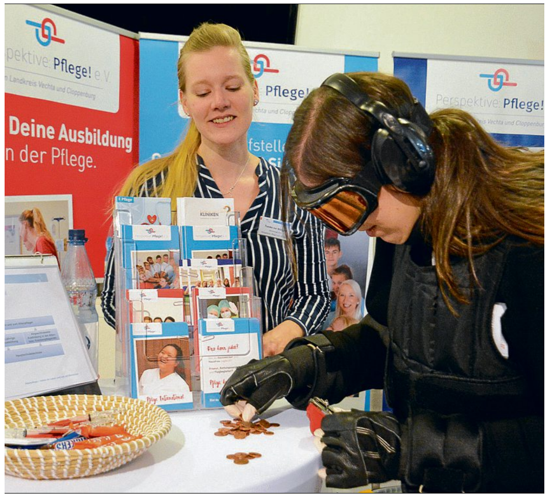
Den Beruf hautnah kennenlernen: Die 3. Messe Abi Lohne am 29. Februar macht's möglich.